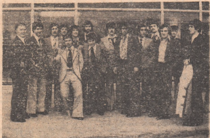
Grupul fotbalistilor spanioli la câteva momente după sosirea în Capitală

Seleccionata Spaniei a sosit ieri la ora 17, în Capitală, la bordul unui avion special al companiei Iberia. Lotul fotbalistilor antrenați de Ladislau Kubala, este însoțit de președintele federației spaniole de fotbal, Porta Buusoms, de un grup de ziaristi și fotoreporteri și de câțiva suporteri. La sosire, oaspeții au fost întâmpinați de conducători ai federației noastre de specialitate, de ziaristi.