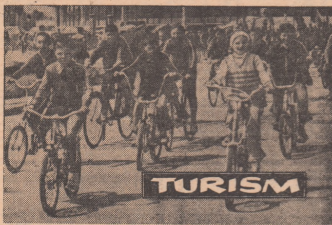
Un drum des străbătut de numeroși elevi bucureșteni: Piața Științei — Pădurea Băneasa. Aceasta, firește, pe biciclete.

Tot miine, în cadrul programelor prilejuite de etapele județene ale „Crosului tineretului” vor avea loc și numeroase alte manifestări sportive dotate cu Cupa „A 55-a aniversare a creării U.T.C.” excursii, acțiuni culturale-educative și de muncă patriotică pentru amenajarea și înfrumusețarea bazelor sportive din întreaga țară.