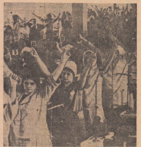
„Repriză” de gimnastică, în schimbul de dimineață, la întreprinderea „Tesătura” din Iași.