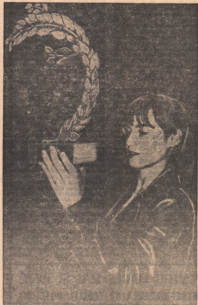
O imagine de la festivitatea de ieri: Nadia Comăneci cu Trofeul acordat de A.I.P.S.

Faptul că Nadia Comăneci primește un Trofeu al ziarștilor din presa scrisă, din radioul și televiziunea mondială, este plin de semnificații, deoarece aceștia nu fac altceva decît să exprime admirația de care, peste