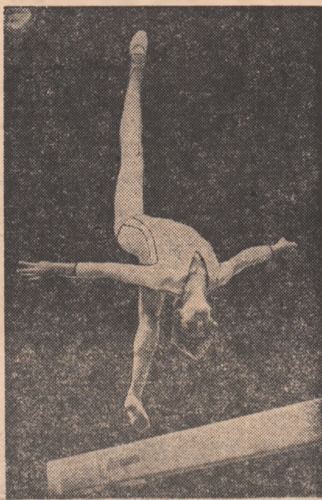
O grăitoare dovadă a marii măiestrii a Nadiei Comăneci la birnă: o execuție de nota 10!

BOLOGNA, 18 (prin telefon). Iubitorii sportului din localitate au trăit o admirabilă seară, pe care — după propriile lor declarații — nu o vor uita multă vreme. În cluda vremii neprielnice (aici a plouat torențial în timpul zilei) și sfidând concurența finalei Cupei U.E.F.A. (în care era angajată și echipa italiană Juventus Torino), 4.000 de spectatori s-au instalat în