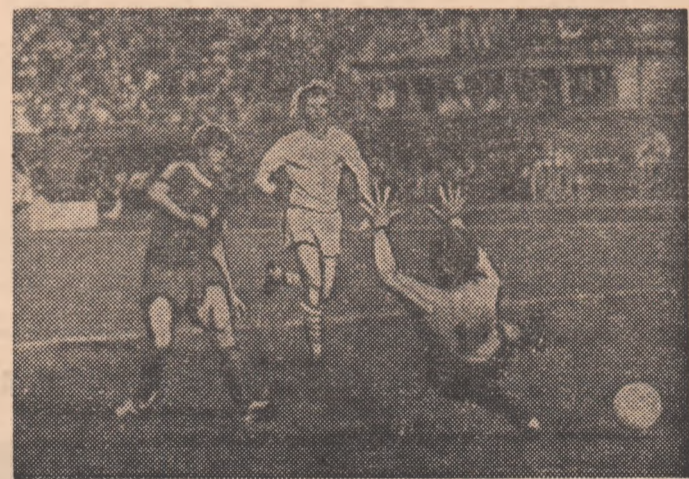
Năstase a șutat plasat, deschizînd scorul (Fază din meciul Progresul — Steaua, disputat ieri)