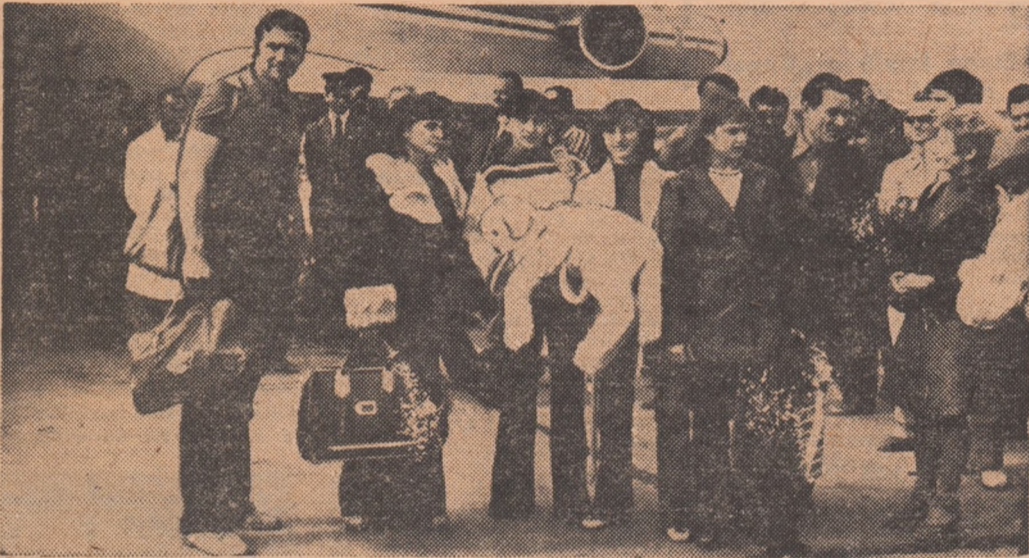
Ieri, pe aeroportul Otopeni, la inapoierea gimnastelor noastre de la Bologna...