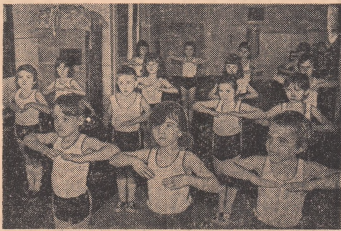
În cadrul acțiunilor organizate sub egida „Daciadei”, la Industria linii din Timișoara au fost inițiate întreceri pentru copiii angajaților.

În grupajul de astăzi — însemnări despre spectacolul sportiv dedicat frunțașilor în producție la Aiud, despre Spartachiada militară de vară, despre fructuoasa activitate a cooperativelor constănțene, precum și scurte știri despre acțiunile și întrecerile desfășurate la Sibiu și Satu Mare.