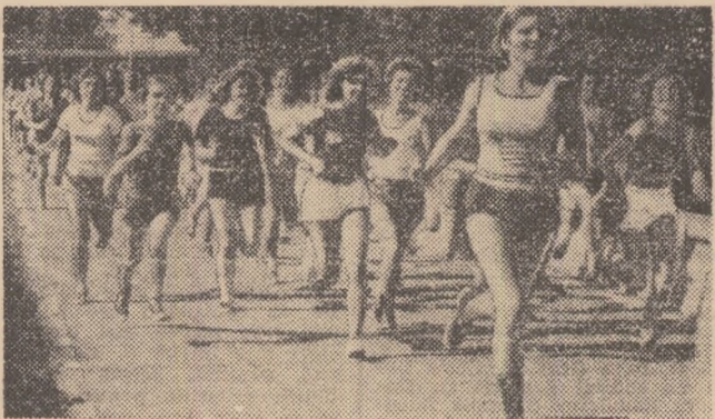
Tineretele arădence ne-au relevat interesul lor pentru activitățile sportive de masă, recent, cu prilejul „Decadei sportului feminin” organizată sub egida „Dacia 77”. Secvența de mai sus le înfățișează, pe faleză însoțită a Mureșului, în timpul alergării de cross...