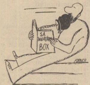
Fără cuvinte TRAIAN FURNEA