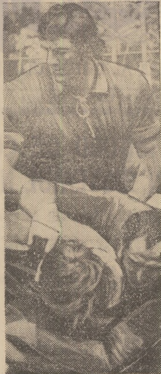
Cu alura sa impresionantă, Pinte domină grămada...

desc la retragere. Rugbistul Pinte se gîndește însă la meciul cu Franța, la viitoarele partide ale echipei de club și ale reprezentativei României.