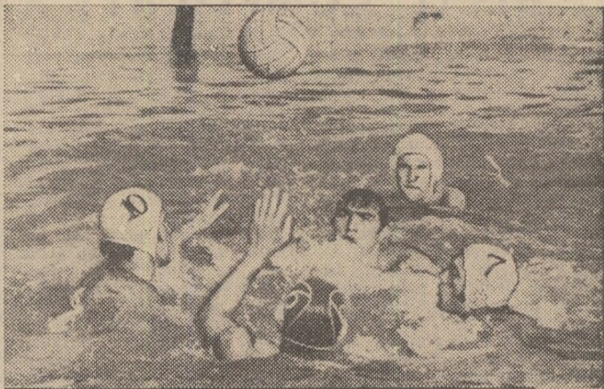
Imagine de la ultimul antrenament al poloștilor români înaintea plecării la Jönköping

În dimineața zilei de 14 august, la „Rosenlundsbadet“ din Jönköping va răsuna primul fluier al arbitrilor în cel de al 11-lea campionat european de polo. Sorții au decis, pentru partida inaugurală, un veritabil derby al competiției, care va opune campiona olimpică de la Montreal, echipa Ungariei, actuala campioană a lumii, selecționata U.R.S.S. În afara celor două redutabile formații, întrecerile grupei A (căci există și un turneu paralel pentru 8 echipe din grupa B) vor mai reuni la această ocazie selecționatele României, Italiei, Iugoslaviei și Spaniei, R. F. Germaniei și Suediei. Cu alte cuvinte — tot ce are mai valoros la această oră polo-ul european.