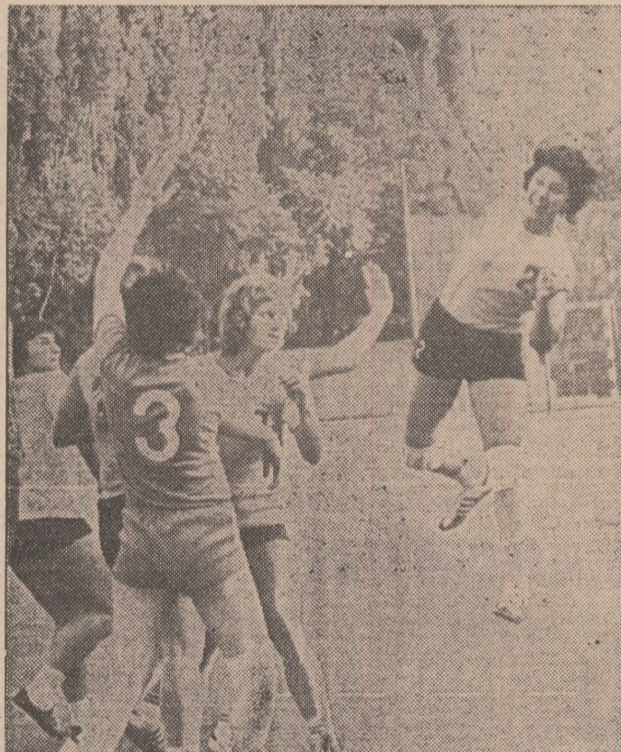
Echipele studențești s-au afirmat puternic în handbalul nostru feminin, ocupînd ani în șir primele trei locuri în Divizia A

STUDENTII , avînd înscrise cu mîndrie pe fanionul lor sportiv Știința, echipa de rugby din prima divizie și cea de fotbal din Divizia C, desfășoară și o bogată activitate de recreare și mișcare. Anul acesta se așteaptă o parti-