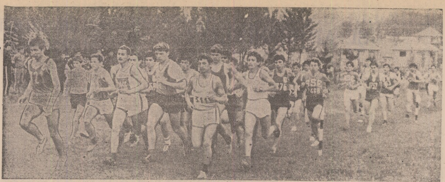
La întrecerile de cros participă întotdeauna un mare număr de elevi din școlile de toate gradele

Actiuni atractive, beneficiarii bazelor sportive... o bună colaborare a fizice și sportului