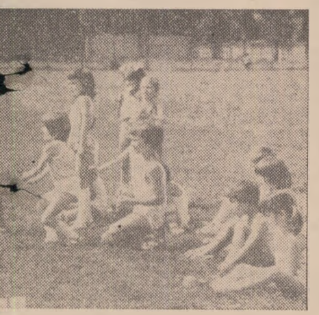
saltea în aer liber constituie un excelent mijloc

De acord. — Ce este nou în pregătirea și repartizarea cadrelor? — Voi începe cu repartitia: va crește eficiența lecțiilor de educație fizică și a activității sportive de masă și de performanță în școală prin încadrarea cadrelor cu absolvenți ai învățămîntului de specialitate. Județele deficiente (Tulcea, Buzău, Brăila, Bacău ș.a.) au fost sprijinite în preocuparea lor de a-și asigura necesarul de cadre calificate. Din acest an s-a creat la I.E.F.S. anul IV, în cadrul căruia vor fi școlarizați cei mai buni absolvenți ai facultăților de educație fizică, selecționați pe baza rezultatelor obținute la învățătura, a categoriei de clasificare sportivă și a aptitudinilor pentru activitatea pedagogică și cercetarea științifică. Aceștia vor deveni specialiști cu înaltă calificare, la fel de utili învățămîntului, activității de performanță, de cercetare științifică și activității mișcării sportive.