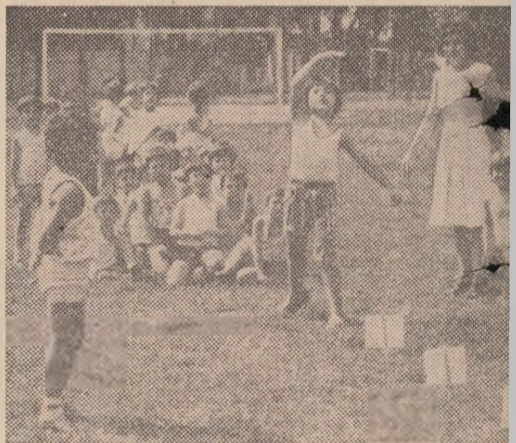
La grădinițele din cartierul bucureștean Pantoloc de întărire fizică a copiilor