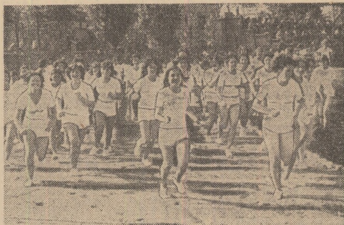
Ieri în crosul de la I.R.E.M.O.A.S.