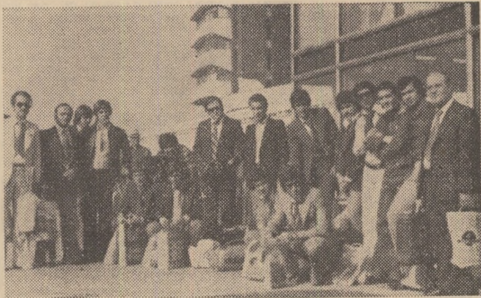
Iată-i pe fotbaliștii eleni în fața aeroportului Iopeni, la cîteva minute de la sosirea în Capitală.

Ieri, spre seară, jucătorii eleni au efectuat un ușor antrenament de acomodare pe stadionul Sticaua, iar așlăzi după-amiază vor face un altul,