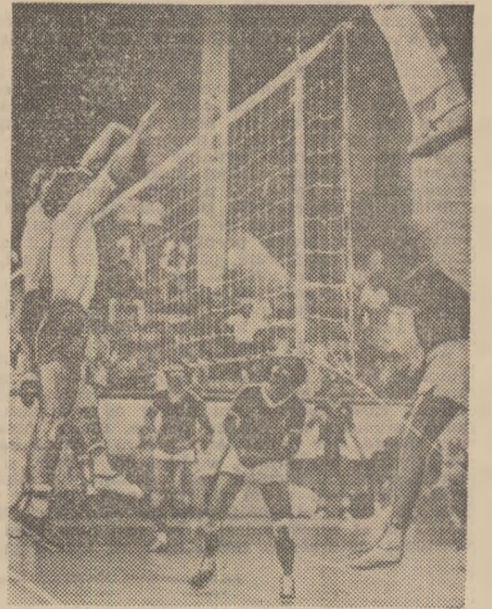
Blocajul - atu pe care îl dorim cât mai bine valorificat de echipa masculină a României și la campionatele europene.

KOTKA: Finlanda - R. F. Germană, Bulgaria - Polonia, Italia - R. D. Germană; TURKU: U.R.S.S. - Cehoslovacia, Olanda - Ungaria, România - Iugoslavia