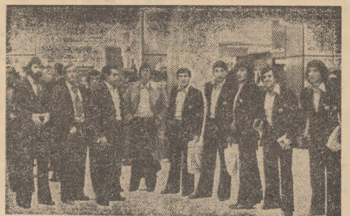
Cițiva dintre jucătorii spanioli la sosirea în Capitală. Al doilea din stînga: Neeskens. Al patrulea — Cruyff.