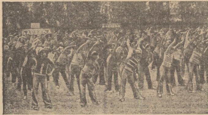
Unul din momentele foarte reușite ale programului sportiv care a avut loc la complexul sportiv Steaua: „repriza” de gimnastică de ansamblu.

Un tânăr profesor întreabă în dreapta și-n stînga: „ Cuț să-l spun? Am un băiat grozav