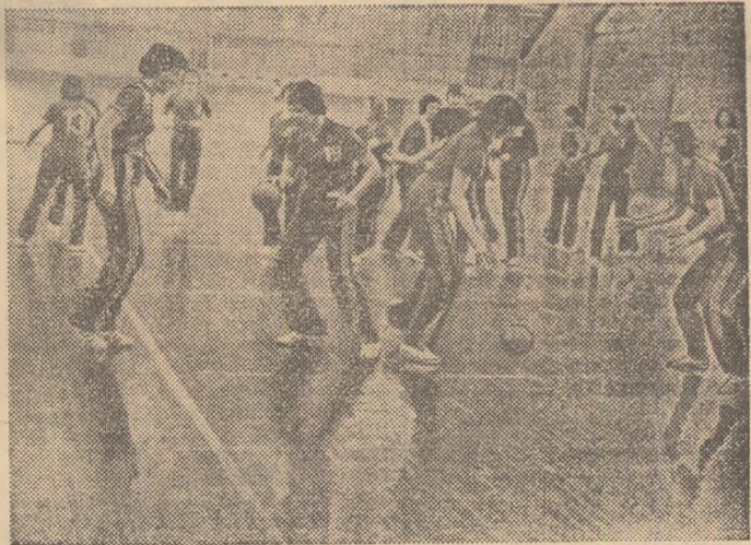
Junioarele noastre continuă pregătirile. Iată o imagine de la un antrenament al tinerelor sportive române care se pregătesc pentru primul campionat mondial.

Acum, cînd apar aceste rînduri, 16 tinere handbaliste din țara noastră trăiesc cu intensitate momentele dinaintea startului într-o mare competiție. Sînt componentele lotului reprezentativ al României pentru C.M. de junioare, dispută care se anunță foarte echilibrată și în vederea căreia ele s-au pregătit cu conștiințiozitate și perseverență, fiind hotărîte să