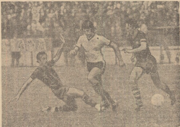
O fază caracteristică din acest joc. Internaționalii olandezi Cruyff și Neeskens, primii autori ai victoriei echipei spaniole, se suplinesc pentru a-l depozeda pe Stoica. (A.mănunte în pag. a 3-a).