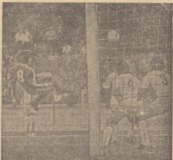
Aflat în plin zbor, golgeterul european Dudu Georgescu înscrie prin foarfecă primul gol în poarta tirgovișteană