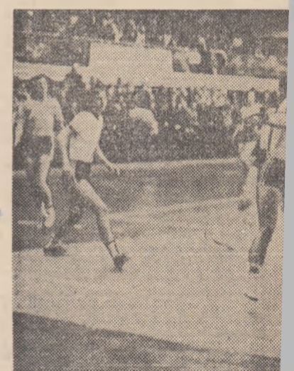
Secvență dintr-o fază de atac la jocul de handbal. Jucătoarea cu nr. 5 de la Confecția