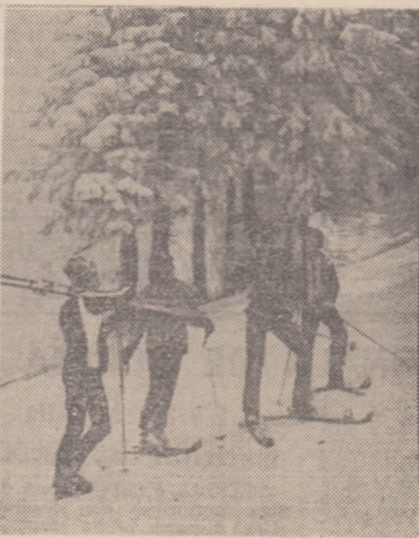
Spre start

Sâmbătă și duminică a fost mult soare în Poiana Brașov și toată lumea cerea „Pirtie!... Am cerut și noi „Pirtie liberă“, iar puștimea — totuși, înțelegătoare în aceste ultime ore ale vacanței — ne-a lăsat un fir de potecă prin pădurea mișcătoare de schiuri și săniuțe. Firește, am străbătut-o în grabă, urmăriți de strașnice scrișniri de schiuri înfrinate, de șueratul scurt al bolizilor care treceau. Știam că așii schiului școlar se află undeva, mult mai sus, pe o pantă mult mai grozavă, pe o pirtie care numai cind îi pronunți numele te infioră: Pirtia Lupului!