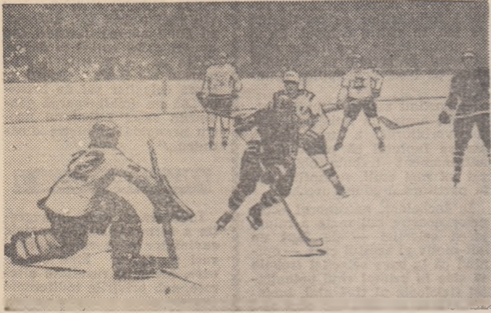
Nistor a scăpat pe atac, dar va fi blocat de portarul dinamovist Gh. Hușan. (Fază din meciul Dinamo - Steaua, disputat simbătă în Capitală).

moase și spectaculoase, rămî- nind angajați în luptă pentru titlu și relansind disputa din campionat. În clasament situația înaintea turului al 6-lea este următoarea: 1. Steaua 16 p; 2. Dinamo 14 p!