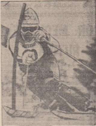
Suedezul Ingemar Stenmark, li- derul „Cupei Mondiale” (mascu- lin).

Proba feminină de coborire de la Pfronten (R. F. Germa- nia) a revenit austriecei