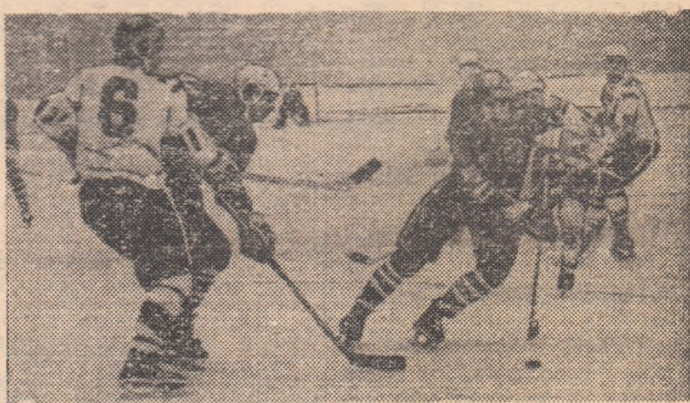
În atac jucătorii echipei Steaua