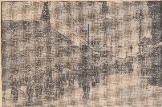
„Alpinii” de la școala din Rășinari în drum spre pirtie