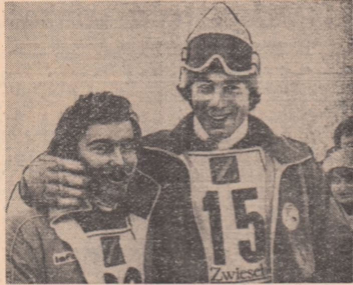
Liderul „Cupei Mondiale”, suedezul Ingemar Stenmark (în dreapta), după coborârea de la Zwiesel, unde și-a consolidat poziția.

Au început întrecerile tradiționalului concurs international de schi fond de la Castelrotto (Italia), contind pentru „Cupa Mondială”. Proba masculină de 30 km s-a incheiat cu victoria italianu-