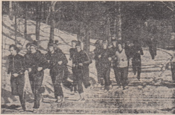
Jucătorii de la A.S.A. lansați în tradiționalul cros montan. Totul este ca acumulările de acum să însemne, în adevăr, o creștere a potențialului de joc. Pentru că de zeci de kilometri acoperiți în fiecare iarnă am tot auzit...