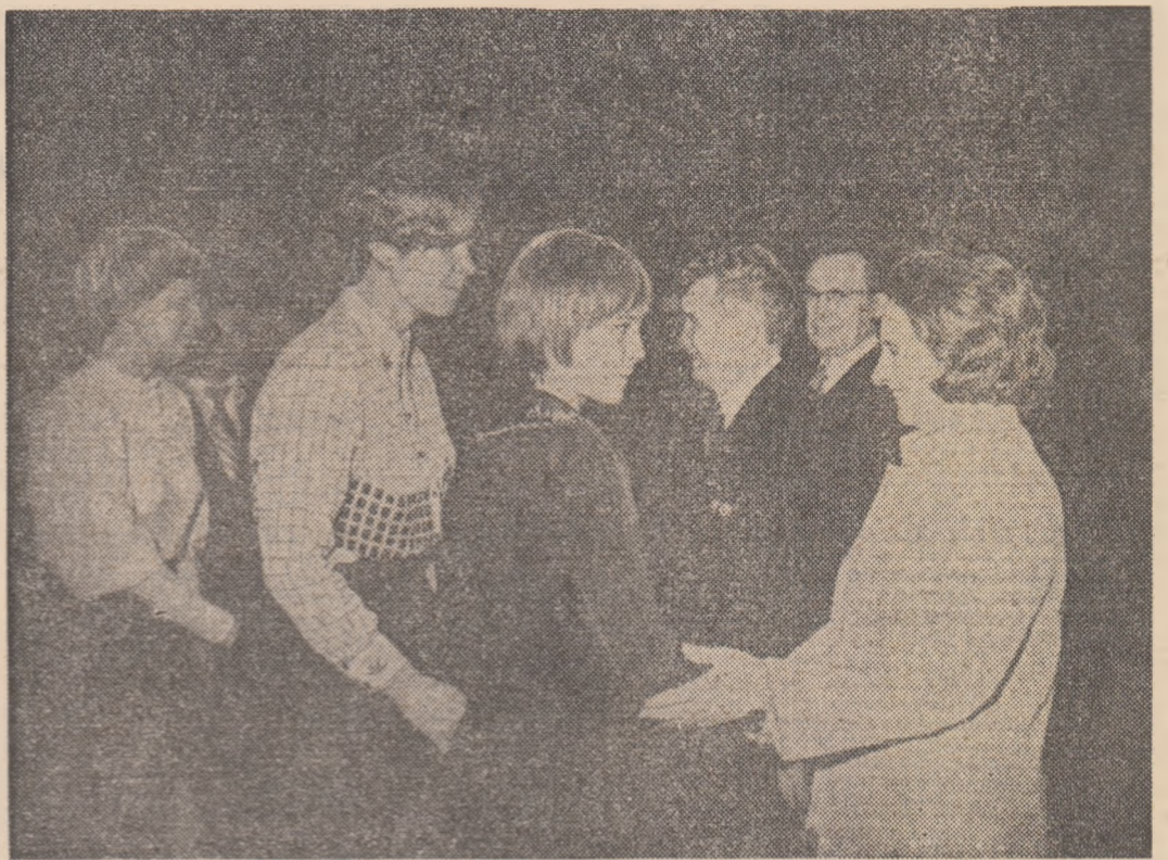
În delegația C.N.E.F.S. care a prezentat tovarășului Nicolae Ceaușescu mesajul de felicitare din partea sportivilor țării s-a aflat și campioana olimpică Nadia Comăneci

În această zi de mare sărbătoare pentru întreaga țară, oamenii muncii aparținând naționalităților conlocuitoare, pășind în pas egal și ferm în glorioasa coloană de peste 21 milioane de ziditori ai Româ-