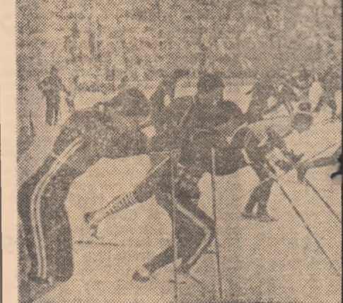
Start în ștăfeta juniorilor mici la campio...

Succesul de organizare, de participare și rezultatele îmbucurătoare, constatate la recent încheiatele campionate de scbi fond pentru juniori, de la Sementic, ne fac să spunem că a sosit și vremea ca schiul nostru de fond să lase hotărît din anonimat pe plan internațional. Tentativa aceasta a fost făcută de mai mulți ani, dar — deocamdată — fără rezultate palpabile, căci prezența sportivilor noștri în dispute cu schiori din alte țări s-a soldat, în marea majoritate a cazurilor, cu eșecuri sursturoare. Cînd spunem că a sosit vremea ieșirii din anonimat, avem în vedere faptul că la întrecerile de pe Sementic au