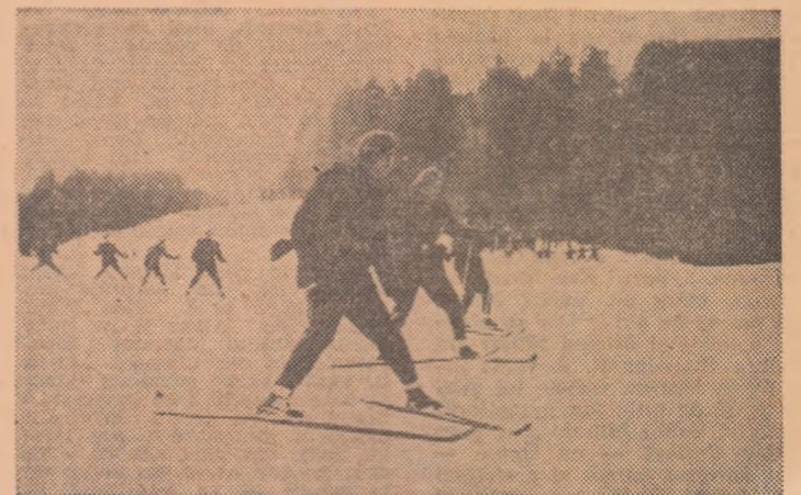
„Coborirea în grup”, din cadrul finalelor Spartachiadei de iarnă a vînătorilor de munte, desfășurate la Predeal, sub egida „Dacia”-dei”. În numărul de miine al ziarului vom publica un reportaj despre aceste întreceri.

de masă — sanie și schi-fond. A încălzit și inimile miilor de localnici, care au fost prezenți la emoționanta festivitate de deschidere.