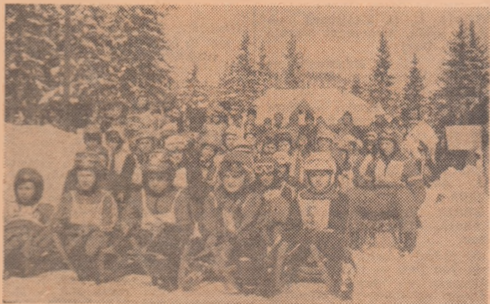
La Harghita-Băi, gata pentru start — finaliștii etapei de iarnă a „Dacia”

MIERCUREA CIUC, 12 (prin telefon). Sîmbătă după-amiază, în orașul cunoscut ca „poa al frigului”, a fost aprinsă flacăra celei mai mari competiții sportive naționale, „Dacia”, adevărată Olimpiadă a sportului românesc, cum a denumit-o secretarul general al partidului, tovarășul NICOLAE CEAUȘESCU,