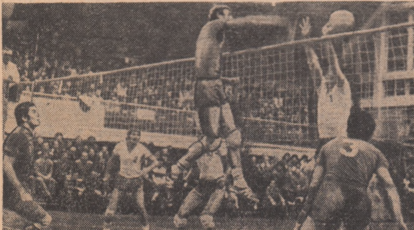
Stelistul Ioan Terbea finalizând o acțiune la fileu „lucrată” de ridicătorul său Aurelian Ion (3). Udișteanu (Dinamo) încearcă să blocheze...