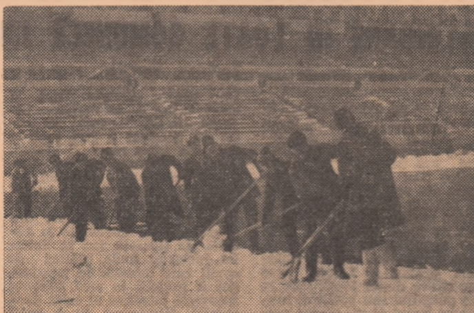
Se acționează intens pentru degajarea dreptunghiului verde de pe Stadionul Republicii

Dar și organizatorii partidelor de duminică au și ei destule probleme de rezolvat, create de un „adversar” capricios și desul de tenace: zăpada. După nota de trecere luată de gazdele „16”-imilor Cupei, duminică trecută — aici elogiem și micile echipe care au demonstrat o frumoasă capacitate organizatorică — ninsura a căzută la începutul acestei săptămîni a așternut un strat gros pe toate terenurile Diviziei A din țară. În această situație cluburile și asociațiile care apar în postura de gazde în etapa inaugurală a returului au intrat în alertă!