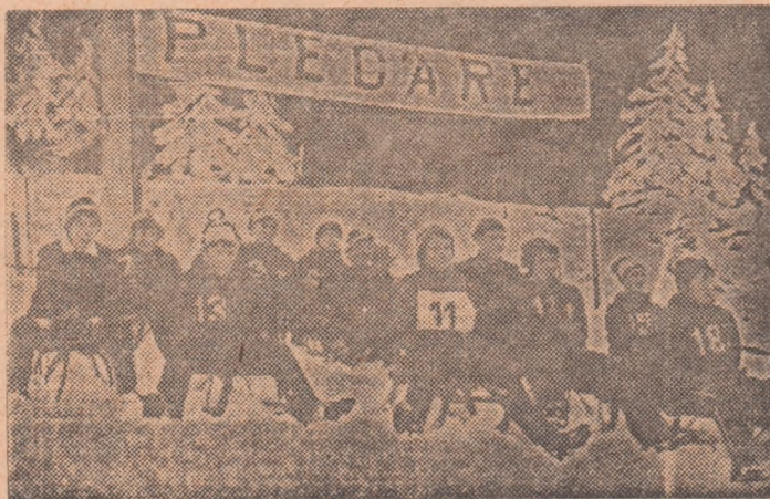
Concurenții categoriei 10-14 ani la startul întrecerilor de sîniuțe.