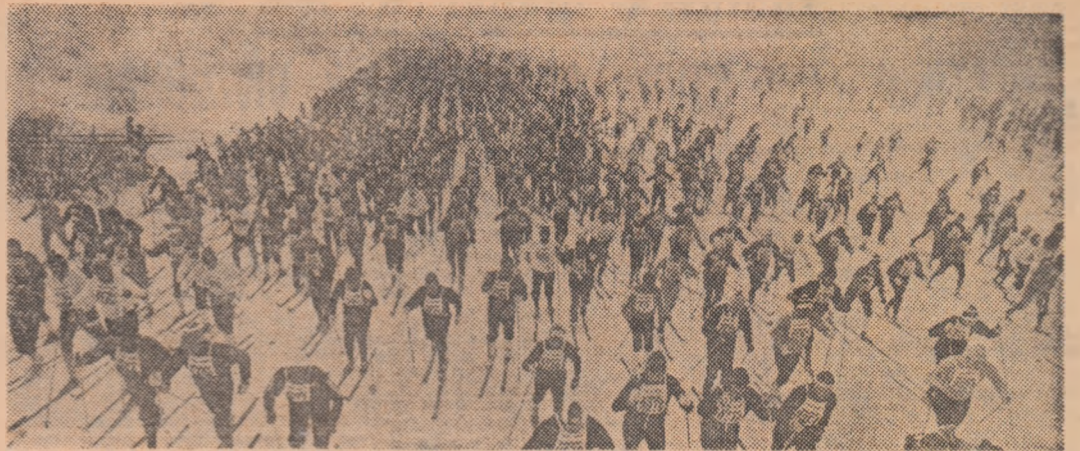
Așa arată — în parte — un start în tradiționala cursă de schi-fond Vasa, din Suedia, pentru că, în mod firesc, în imagine nu pot fi cuprinși cei peste 10 000 de concurenți!