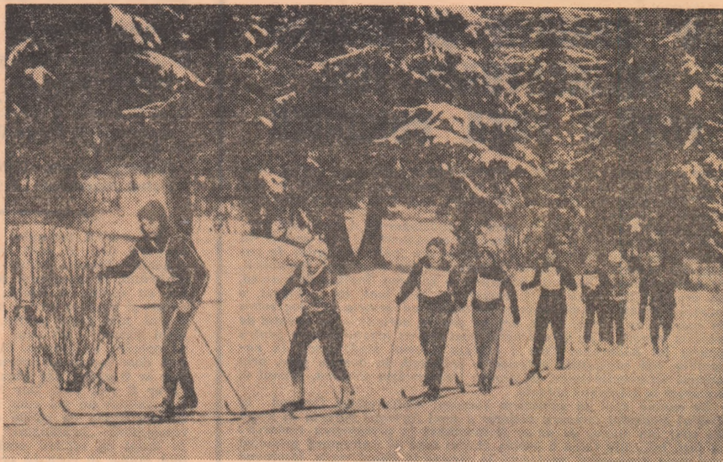
Pe poalea înzăpezită, concurențele își dispută întietatea într-o probă de fond din cadrul ediției de iarnă a „Daciadei”