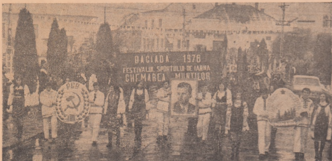
Aspect de la prima ediție a „Festivalului sportului de iarnă” desfășurat la Cimpeni — o reușită acțiune în favoarea dezvoltării schiului în Apuseni

„Țara de Piatră”. Un tărîm de basm, în care de-a lungul anilor zăpezile veneau și plecau, culegînd voioșia puilor de moși ce brăzdau spinările munților cu săniile. Mai puțin cunoscut, schiul părea stingher pe