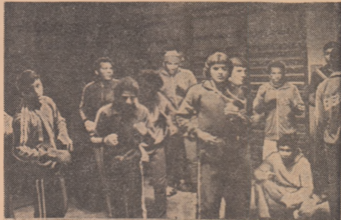
Cea mai numeroasă delegație străină prezentă la „Centura de aur” - cea a Venezuelei - la un antrenament înaintea startului de astăzi.

● Boxerii români înfilnesc chiar din prima zi adversarii valoroși din Cuba și Venezuela