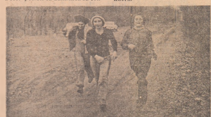
Orientarea sportivă sau sportul care poate fi practicat de orice amator între 3 și 85 de ani...

interview sportiv al vieții sale: „Conduc mașina de mai multă vreme. Astăzi am aflat, însă, că una dintre întrebările sale cele mai potrivite este aceea de a asigura transportul între locuința din oraș și locul unde poți alerga în voie, în aer liber...“