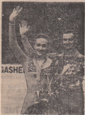
Noii campioni în proba de dans pe gheață, Natalia Liniciuk și Ghenadi Karponosov

Campionatele mondiale de patinaj artistic, încheiate la Ottawa, au stat sub semnul multiplilor surprize. Doar un singur titlu, din cele patru puse în joc, a revenit laureaților de anul trecut, anume excelentului cuplu de „artiști ai gheții” Irina Rodnina și Aleksandr Zaitsev, care și de această dată au demonstrat o superioritate incontestabilă. În toate celelalte probe, lupta a dus la rezultate finale neprevăzute. Cea mai mare surpriză a fost cea de la individual masculin, unde marele favorit, Jan Hoffmann, cedează primul loc pe podium unui „outsider”, patinatorul american Charles Tickner. Se părea că succesul reprezentanților S.U.A. va fi dublat prin victoria la simplu feminin a campioanei de anul trecut, Linda Fratiane. Dar iată că impetuoasa patinatoare din R.D. Germania, Annet Poetzsch, se revanșează pentru înfrângerea de la precedenta ediție și își reintră în drepturi, cucerind medalia de aur. Nume noi și pe prima treaptă a podiumului în între-