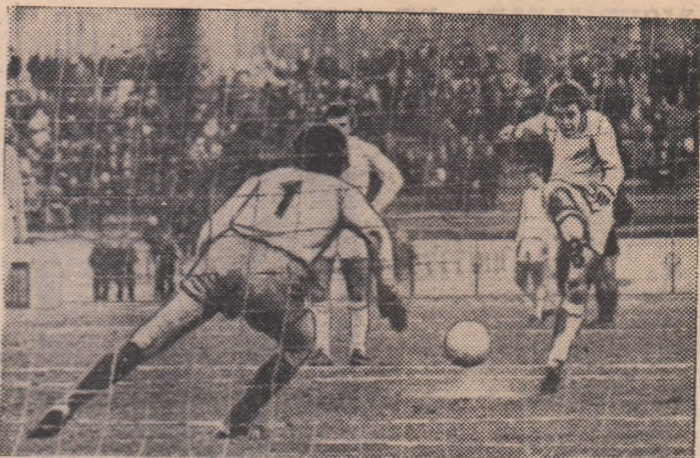
Chitaru va transforma lovitura de la „11 m”, 1-0 pentru S. C. Bacău în înținirea cu A.S.A. Tg. Mureș.

F.C. Bihor a câștigat la un scor de forfaiță partidă cu „11”-le reșițean. Pentru că jucătorii orădeni s-au gândit la demnitatea antrenorului lor, pe care-l respectă. Duminică, F. C. Bihor n-a câștigat numai două puncte în clasament. Ea a apărat și prestigiul unui tehnician respectat din fotbalul nostru.