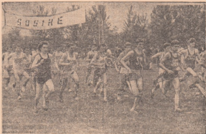
Sub soarele primăverii, în aerul proaspăt al parcurilor, crosurile de masă — prezente în programul „Daciadei” — oferă satisfacția mișcării, bucuria întrecerii, pentru mii de băieți și fete...