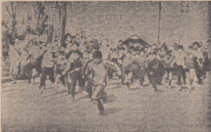
Cros, probă apreciată de copii și ușor de organizat