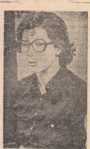
Ing. LIA MANOLIU, vicepreședinte al C.N.E.F.S. și al Comitetului Olimpic Român

● Cred că avem destul tineri capabili să obțină rezultate de un nivel valoric superior și la sporturile de iarnă