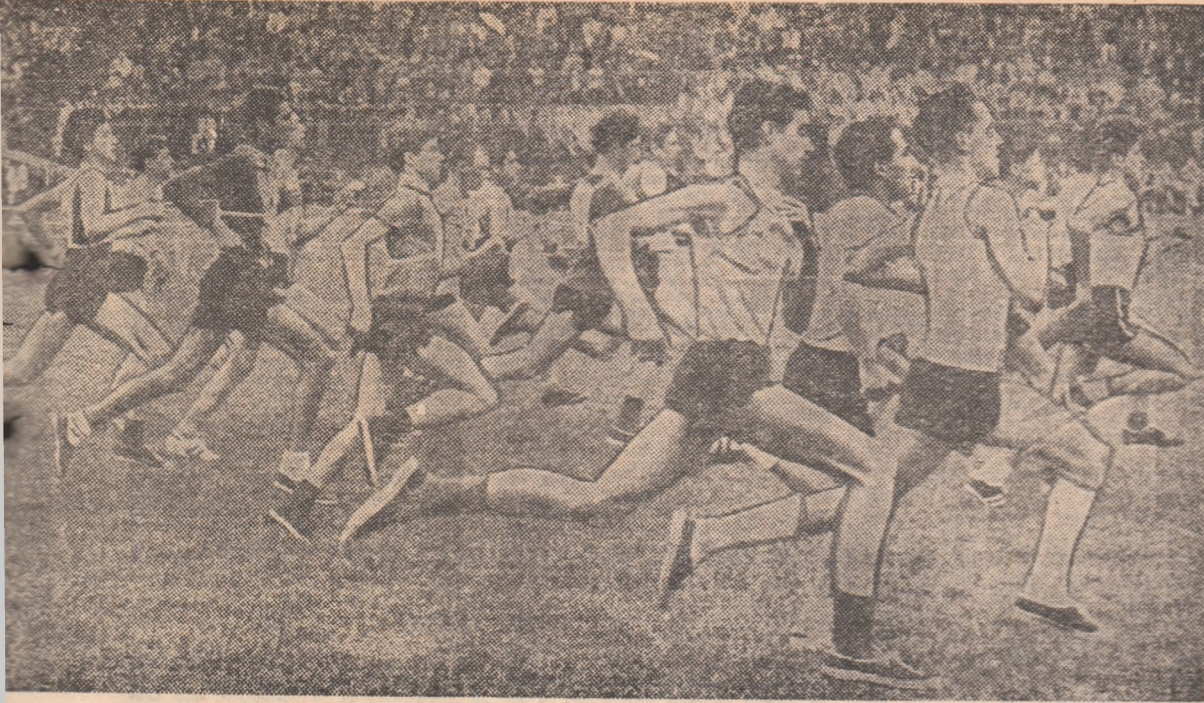
Intrare in atletism, tineri si tinere, o tinut si finala din a Tineretului" din a