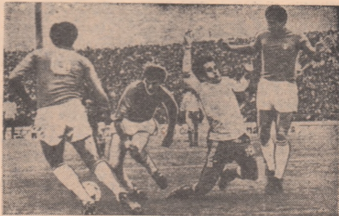
Așadar, n-a fost penalty! Iată-l pe Platini câștigînd, nejenat de nimeni, în careul echipei Italiei (Zaccarelli chiar se ferește să-l atingă pe atacantul francez)! Deci arbitrul Nicolae Rainea a avut dreptate arătîndu-i cartonașul galben lui Platini pentru simulare. De la stînga la dreapta: Scirea Tardelli, Platini și Zaccarelli.