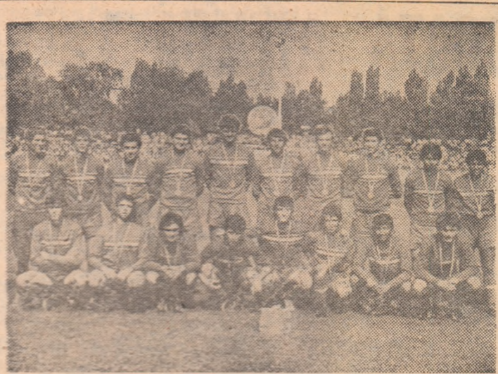
PROGRESUL VULCAN BUCUREȘTI, câștigătoarea ediției 1977—1978 a Campionatului republican al juniorilor și școlărilor.

În finala campionatului republican de juniori