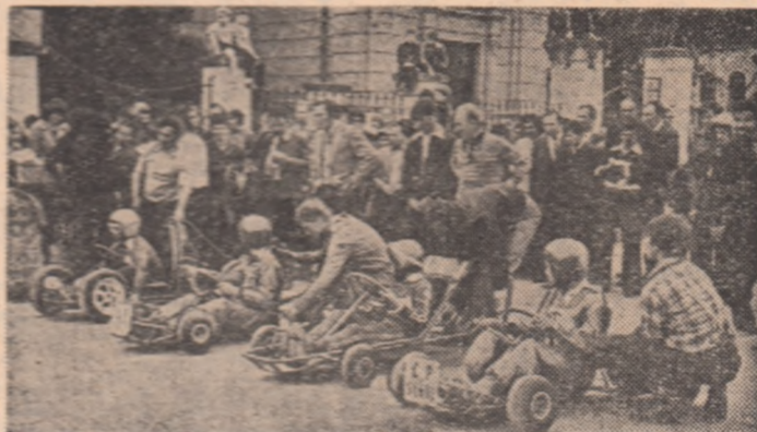
Start într-una din probele „Raliului primăverii”, la care — alături de pionierii din Timișoara — au luat parte și mici sportivi din șase orașe.

„Raliul Harșilor” — prima manifestare de acest gen din județul cu același nume. Concursul, 20 de echipe din Topolca, Odorheea Senească, M. Ciuc și Tg. Mureș, s-au întrecut pe 207 km. Primele trei locuri au revenit echipajelor: 1. A. Orban — L. Șerban (Od. Senească), 2. A. Horvath — M. Ciuc (M. Ciuc), 3. A. Dobrescu — M. Dobrescu (Topolca), primele două copii pe „Dacia 1300”, și tercie — pe „Lada 1300”.