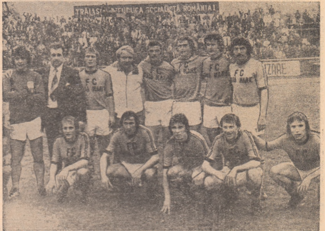
Această imagine a fost surprinsă la sfîrșitul unei partide importante pentru promovarea în Divizia A: F.C. Baia Mare - „U” Cluj-Napoca (1-0), unul dintre derby-urile seriei a III-a

Au trecut 13 ani de cînd Minerul Baia Mare a părăsit primul eșalon fotbalistic. Speranțe de revenire s-au născut aproape în fiecare toamnă; însă, pe parcursul competiției, ele se destrămau. Din octombrie 1976, odată cu preluarea conducerii tehnice de către Viorel Mateianu, optimismul a început să se ridice la cote tot mai înalte. Și, iată, la terminarea actualei ediții a Diviziei B, reprezentanța băimărenilor s-a clasat pe primul loc în seria a III-a și a revenit astfel pe prima scenă fotbalistică a țării.