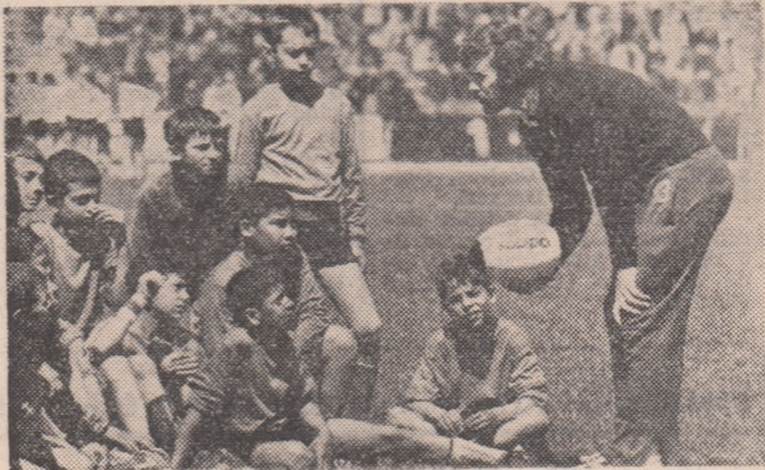
Ciți dintre copiii aceștia, numai ochi și urechi la indicațiile profesorului, vor ajunge, miine, ca Motrescu?...

Petrică Motrescu, ești cel mai fericit căpitan de echipă din rugbyul românesc: ai cucerit, cu Farul, al treilea titlu de campion. Spune-ne, are alt farmec pentru tine vacanța? ● E mai... plină de tensiune! ● Ne faci să înțelegem?? ● Sint un om vesel din fire, îmi place să am prieteni mulți. Dar nu-mi pot permite să uit ce urmează: toată lumea a spus că Steaua are cel mai bun lot. Ne va... ierta ea pentru titlul dus de noi la Constanța? Uite, noul campionat bate la ușă... Și mai e și turneul din Anglia, și apropiatul debut într-o nouă ediție a Campionatului european... ● Știu că ești birlădean de origină și totuși ai devenit un dobrogeean pătimăș cînd vorbești de mare. E firesc, poate. Ești profesor în Constanța — și faci, desigur, rugby cu copiii tăi! —, ai un mic apartament aici, aranjat cu gust. Ești autorizat, cred, să definești poziția Litoralului în rugbyul românesc. Ce te-a im-