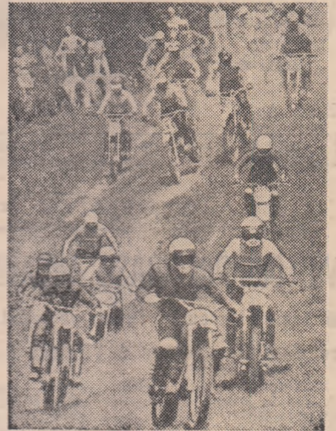
„Cupa Prietenia” reunește an de an pe cei mai buni motocrosiști din majoritatea țărilor socialiste. Iată o imagine de la una dintre etapele ediției trecute, desfășurată pe traseul de la Moreni.

Ajunși la a treia etapă, „Cupa Prietenia” la motocros va continua duminică pe traseul de la Sf. Gheorghe, în organizarea Iorului nostru de resort. Pînă în prezent și-au confirmat participarea echipele reprezentative ale Bulgariei, Cehoslovaciei, R. D. Germane, Poloniei, Ungariei și Uniunii Sovietice. Se așteaptă răspuns din partea federațiilor de specialitate din Cuba și Iugoslavia.