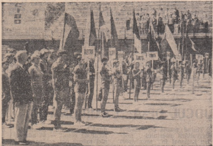
Aspect de la festivitatea de deschidere de pe stadionul central Dinamo din Brașov

găzduiesc „europenele” de tenis, redându-le în întregime culorile vii. Jocurile din această după-amiază a fost precedată de festivitatea de deschidere, cu care prilej cele 12 delegații