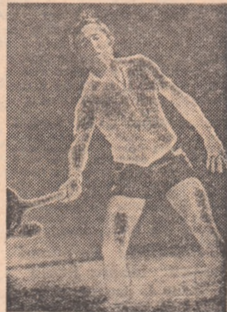
Aleksandr Metreveli (Uniunea Sovietică), pentru a șasea oară campion european de simplu.