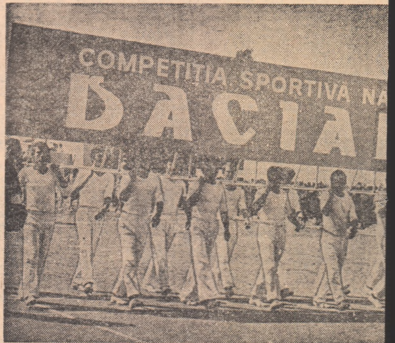
Vigoare, hotărîre, optimism — iată ce se degajă de pe chipurile acestor „Daciadei”

Daciada s-a încheiat, Daciada continuă! „Secvența august” a însemnat, desigur, apogeul primei ediții a „Daciadei”, dar nu și finele ei. Sîrșitul lui august și, mai ales, luna septembrie programează noi dispute, la fel de dirze, la fel de atractive. Campionatele de caiac-canoe juniori și cele de seniori (29 august — 2 septembrie), întrecerile scrimerilor juniori (3-4 septembrie), disputele poloștilor seniori (5-10 septembrie), ca și ale călăreților juniori de la obstacole și dresaj (5-10 septembrie), competiția de baschet — pentru băieți și fete (13-17 septembrie) campionatul de gimnastică al maștrilor