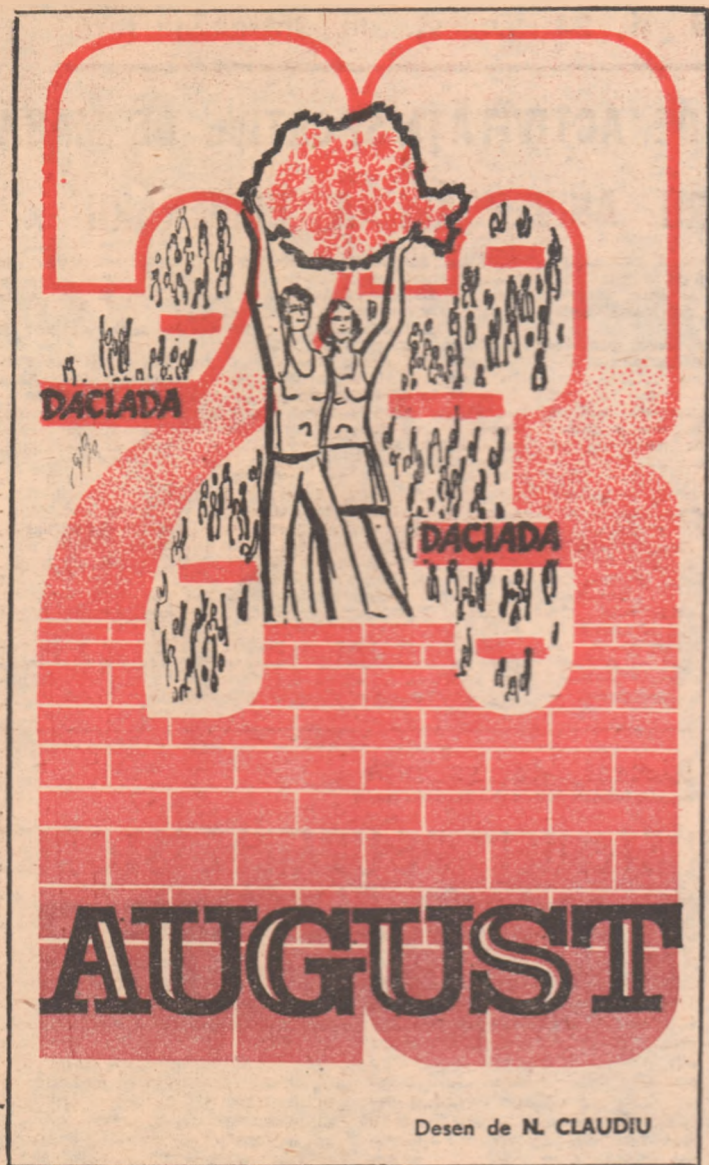
Desen de N. CLAUDIU

Citiți în pag. a 6-a: PROGRAMUL ETAPEI INAUGURALE și „BULETINUL DE ȘTIRI” AL CELOR 18 DIVIZIONARE A