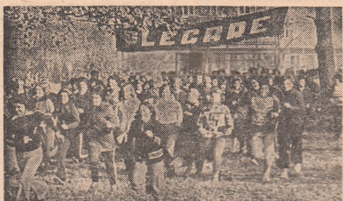
Formă simplă și accesibilă de practicare a sportului. Crosul se bucură de multă popularitate în rândurile tineretului

De o mai mare atenție s-a bucurat dezvoltarea educației fizice și sportului feminin. În județele Prahova, Argeș, Vaslui, Mureș, Arad, Covasna ș.a. au avut loc festivaluri ale sportu- lui feminin, care au reunit mun- citoare și sătence, eleve și stu- dente. Interesant de reținut este faptul că asemenea mani- festări județene au avut loc, nu întimplător, în localități mai