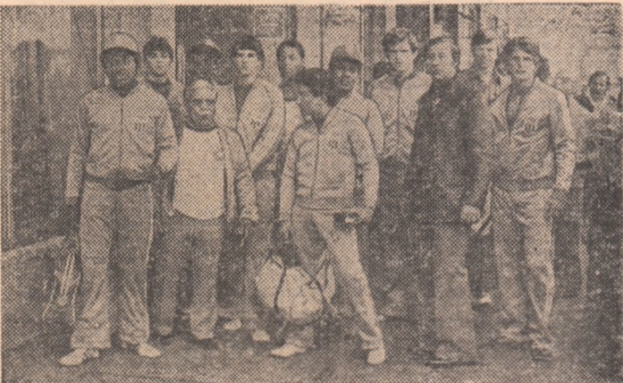
ECHIPA AMERICANĂ DE BOX LA BUCUREȘTI