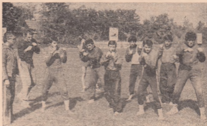
Boxerii din echipa României, la ultimul antrenament

Astăzi-seară, la București, începînd de la ora 18, pe ringul montat în incinta Palatului Sporturilor și Culturii se va desfășura meciul internațional de box dintre echipele României și Statelor Unite ale Americii. Ținînd seama de valoarea celor două formații, se așteaptă partide extrem de disputate și atractive. Troy Summers, șeful delegației americane, ne-a declarat că pugiliștii selecționați pentru turneul din România sînt tot ce are mai bun boxul amator din S.U.A. la ora actuală.