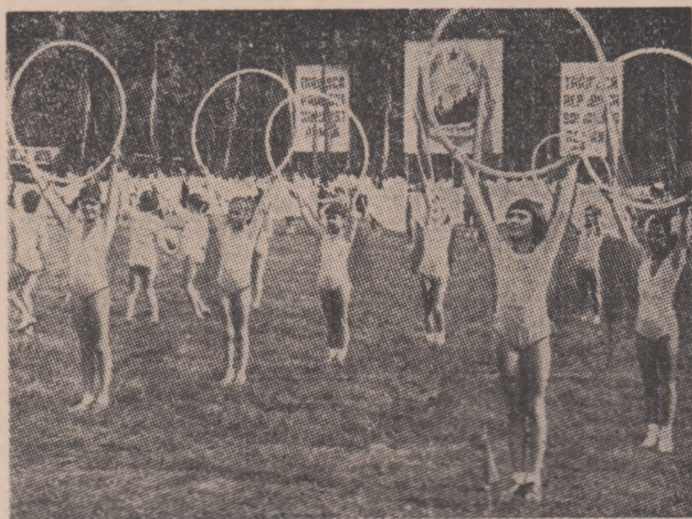
Îndrăgită și practică tot mai mult de preșcolari și pionieri, gimnastica, demonstrație de gingășie și frumusețe, se va afla și în acest an de învățămînt între sporturile preferate ale copiilor

organizația „Șoimilor patriei” și cea a cravatei roșii cu tricolor din județele Prahova, Timiș, Suceava, Vilcea, Harghita, Brașov, Alba, Galați, Cluj și din municipiul București. Vom face