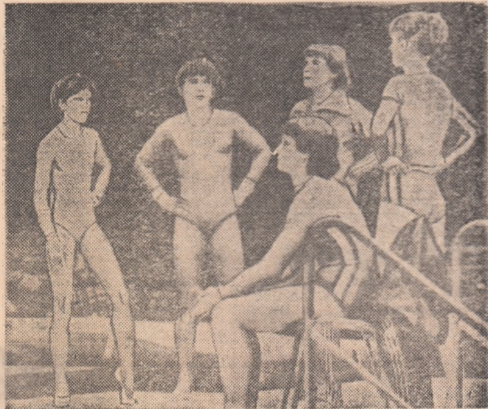
Imagine de la unul din ultimele antrenamente ale echipei feminine a țării noastre, primită ieri prin rețeaua agențiilor internaționale de presă

STRASBOURG, 23 (prin telefon). Campionatele mondiale de gimnastică au început luni aici cu exercițiile împuse ale băieților, exerciții care, deși nu sînt spectaculoase și se află pe calea dispariției în viitorul apropiat, așa cum au afirmat unii specialiști la recentul congres F.I.G., au atras totuși în sala „Rhenus“ foarte mulți spectatori. Netransmiterea pe micile ecrane a întrecerilor, din cauza grevei tehnicienilor T.V. de aici, care privează nu numai Franța, ci și întreaga lume de acest frumos spectacol, a făcut ca un mare număr de iubitori ai acestui sport să se deplaseze în ultimul moment la sala de concurs.