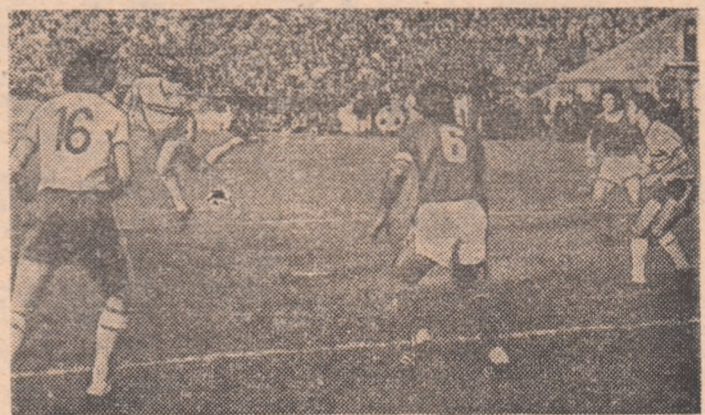
Sameș înscrie spectaculos golul egalizator