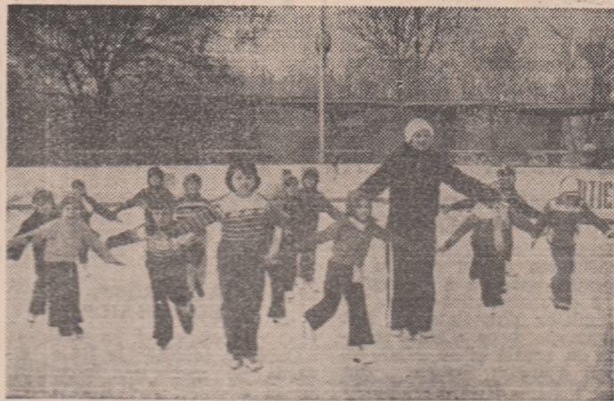
Grupa de „artiști ai gheții” de la Școala generală nr. 10 din Floreasca