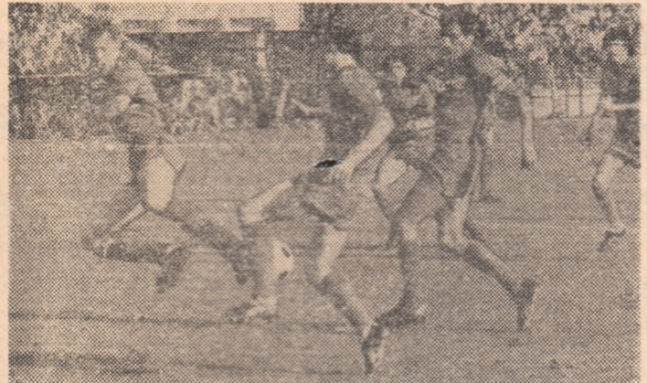
A.S.A. în acțiune. În stînga, tînărul Körtessi pare lansat de „bătrînul” Ispir, căpitanul echipei.