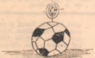
Proiect de minge de fotbal (pentru înaintași... fără adresă) MATEI MIHAI — București