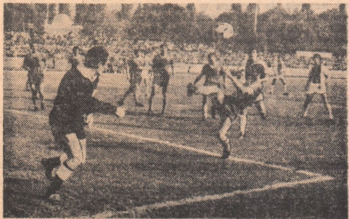
Mare aglomerație în preajma porții Corvinului, așa cum a fost de atîtea ori în meciul cu Dinamo, de la București, încheiat cu un 0-4 cit se poate de firesc

jucători și-a cam schimbat alcătuirea. Unii au plecat, alții n-au mai fost folosiți din așteptate motive, cum ar fi Cassai, Gruber, Niculescu, Vlad, Vișan, Klein, Albu. Între timp, din motive disciplinare, Miculescu a fost scos din lot. Lucescu a fost multă vreme indisponibil, E. Nunweiler a avut alte obligații (!?), examene