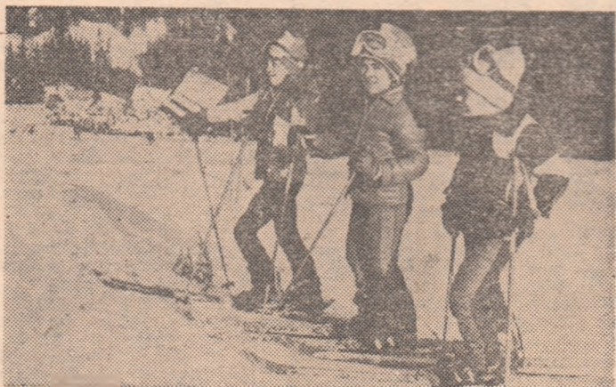
Pe pirtia de la Clăbucet — Predeal, trei „pitici” din cei 70 sau 7×70 sint gata de start, stimulați, evident, de „buletinul zăpezii”, care admiră echipamentul ultraeleganț, dar e decis să le pună bețe-n schiuri, chiar înainte de SOSIRE.