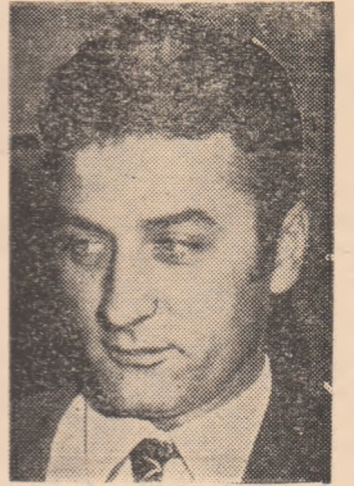
Impresionat neplăcut căderea „soliștilor” Steaua și Politehnica Timișoara.

— Mi-a plăcut asaltul echipelor slab cotate: Baia Mare, Iașul, Tirgoviștea, Satu Mare, Buzăul. M-a surprins și m-a